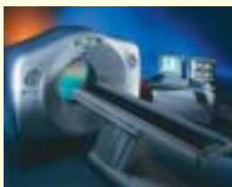
マルチスライス16列